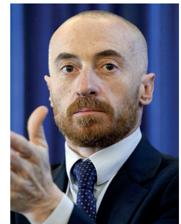
Jury Chechi Olimpionico