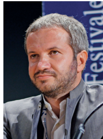
Claudio Borghi Aquilini

Parteciperanno compatibilmente con gli impegni istituzionali.